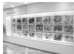
ROX 5F ファミリーギャラリー

※入賞作品の一部はROXの年末年始ポスター、ROXおよび株式会社テーオーシーグループの年賀状に使用する場合がございます。※作品がポスター・年賀状および展示用に採用された場合、お子様の氏名・年齢・性別・学年・学校名(幼稚園・保育園等含む)が公開される場合がございますので、予めご了承ください。※ご記入いただきましたご連絡先の情報は、コンクール事務局から入賞やその他の連絡等に使用させていただきます。※内容は予告なく変更になる場合がございます。※応募されたことによって、上記内容に同意されたものとみなさせていただきます。